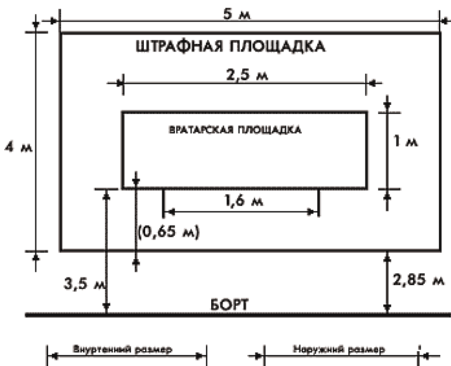
Рис.2. Размеры штрафной площадки